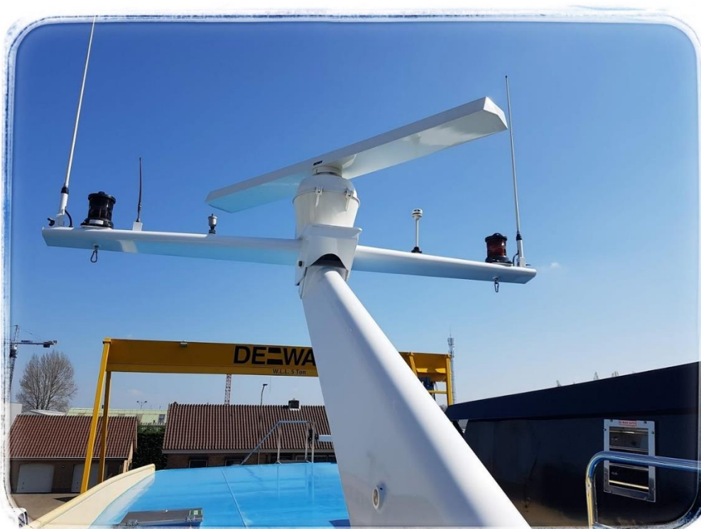
Optie D-vleugels en gespoten uitvoering

Door te kiezen voor een conservering of polijsten heeft de mast meer uitstraling en blijft deze beter corrosiebestendig.